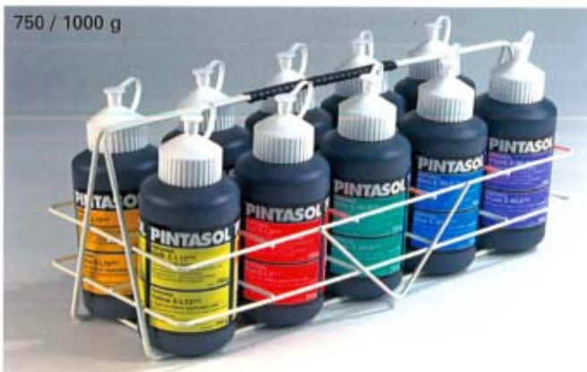
750 / 1000 g

I Non tutte le pitture o vernici possono essere colorate con *PINTASOL! Per vernici speciali, a seconda del tipo e della marca del prodotto, si potrebbero verificare casi di incompatibilità. Perciò i coloranti *PINTASOL sono utilizzabili solo in particolari condizioni per pitture al solvente, pitture alla pliolite o ai copolimeri, per pitture elastiche, poliesteri, vernici al poliuretano e a fuoco è necessario effettuare delle prove di compatibilità e di adesione!